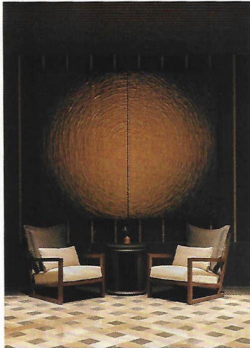
La terrasse-jardin de l'hôtel, installé sur la Cinquième Avenue, et une vue du lobby.

MANHATTAN Le luxueux groupe hôtelier né en Thaïlande vient d'ouvrir un établissement urbain à deux pas de Central Park. Ambiance feutrée ponctuée de pièces d'art(isanat), club exclusif et détails très soignés, de quoi combler les adeptes de la chaîne surnommés les « Amanjunkies ».