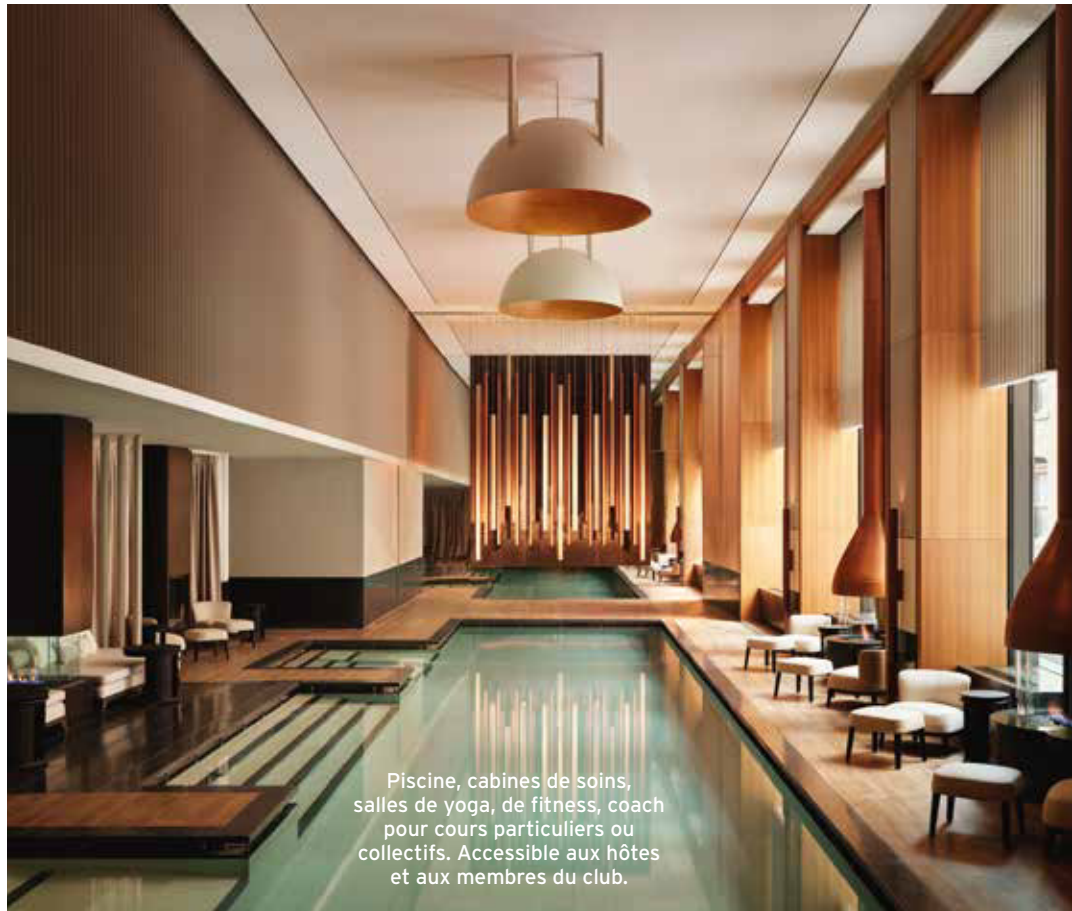
Piscine, cabines de soins, salles de yoga, de fitness, coach pour cours particuliers ou collectifs. Accessible aux hôtes et aux membres du club.